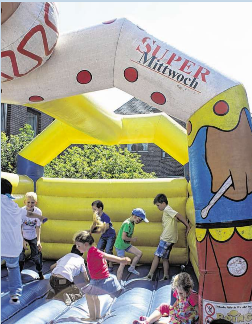
Damit die Kinder am Samstag neben dem Fußballspielen auch im Rahmenprogramm ganz viel Spaß haben können, darf natürlich die Hüpfburg des Super Sonntag/Super Mittwoch auf der Anlage in Übach-Palenberg nicht fehlen.